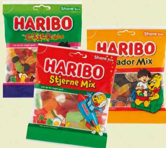
HARIBO Flere varianter. 80-120 g. Max. kg pris 125,00.