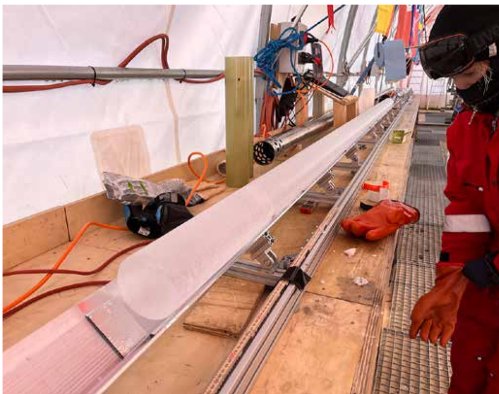
Registrering af iskerneprøver.

Forskere når ned i 1,2 million år gammel is og rammer grundfjeldet i Antarktis