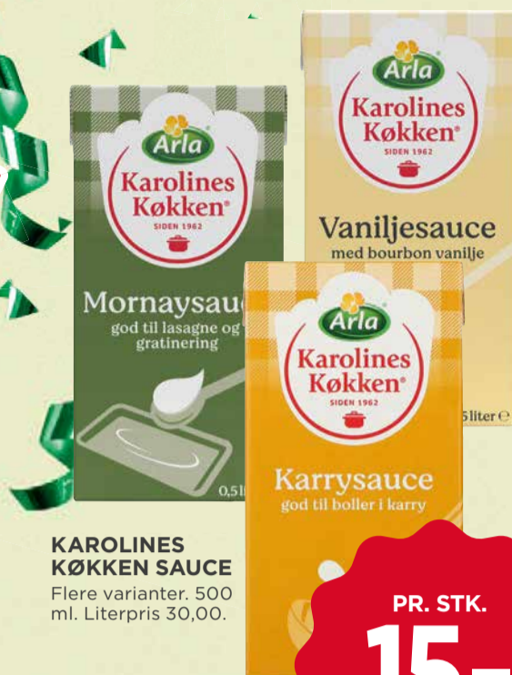
KAROLINES KØKKEN SAUCE Flere varianter. 500 ml. Literpris 30,00.