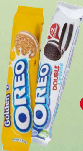
OREO Flere varianter. 114-157 g. Max. kg pris 131,58.