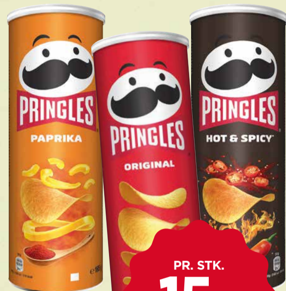
PRINGLES Flere varianter. 165 g. Kg pris 90,91.