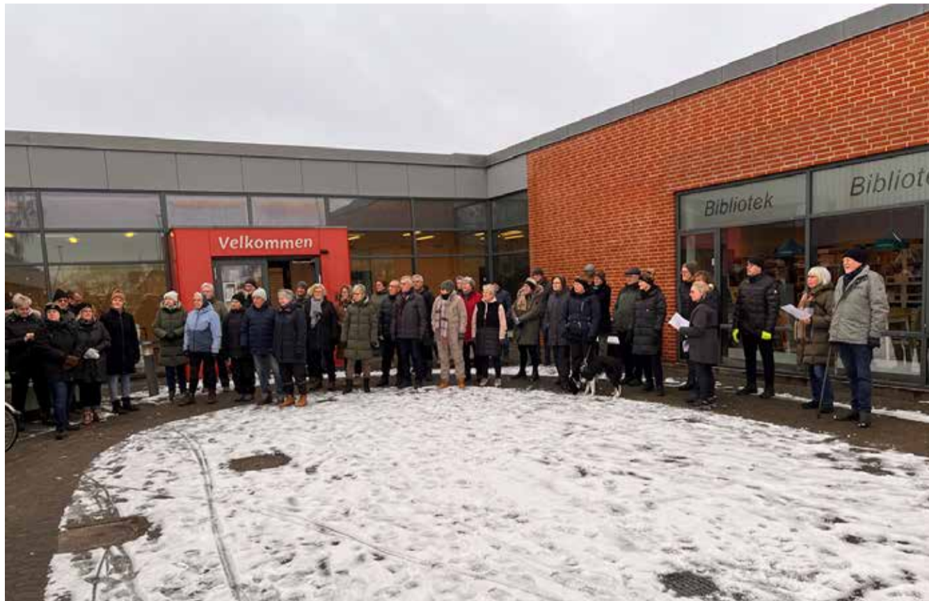
- Af Lone Danielsen.

Traditionen tro holder Hjerteforeningen Nytårsmarch i bl.a. Sdr. Omme, hvilket skete søndag den 5. januar, hvor ca. 50 deltagere startede nytåret med en frisk gåtur i den dejlige friske natur omkring Sdr. Omme.