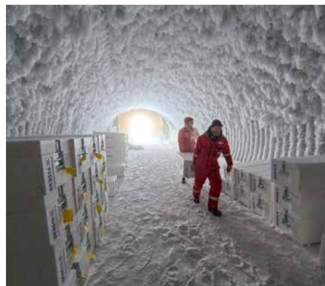
Snehulen, hvor iskernerne opbevares