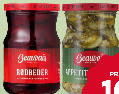
BEAUVAIS SURVARER ELLER HERREGÅRDSRØDKÅL Flere varianter. 251-375/380-720 g. Max. kg pris 63,75.