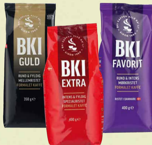
BKI FORMALET KAFFE Flere varianter. 300-400 g. Max. kg pris 133,17.