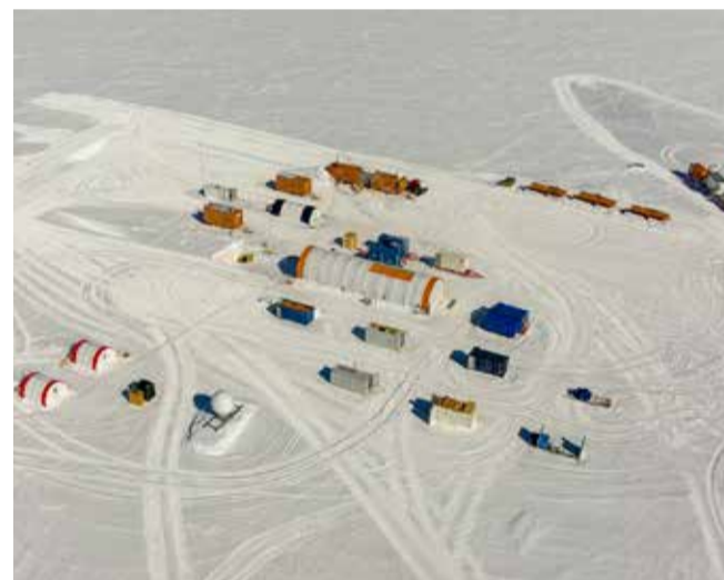
Luftfoto af borelejren Lille Dome C

efterprøves ved at analysere den gamle luft i de luftbobler, som iskernen indeholder.