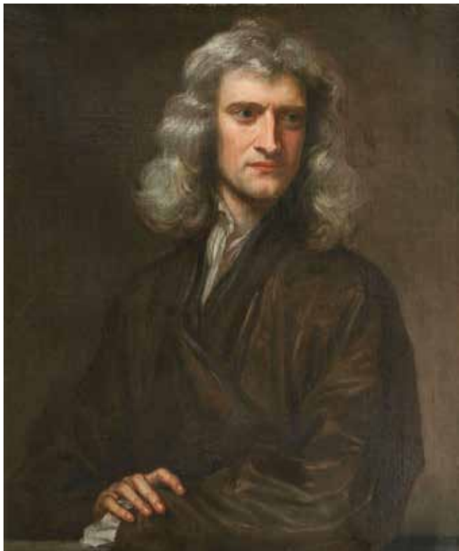
Portræt af en 46 årig Isaac Newton, 1689. Portrætteret af Godfrey Knellers.