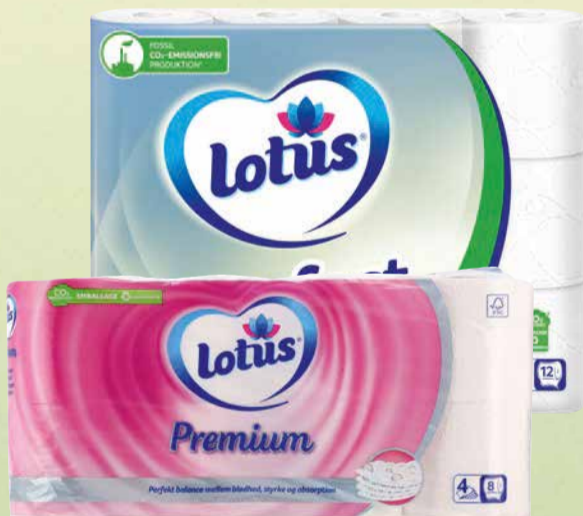
LOTUS TOILETPAPIR ELLER KØKKENRULLER 6 Premium køkkenruller, 6 ruller Just-1 toilet-papir, 8 ruller Premium toilet-papir eller 12 ruller Comfort toilet-papir. 606-1040 g/6-12 stk. Max. kg pris 66,01.