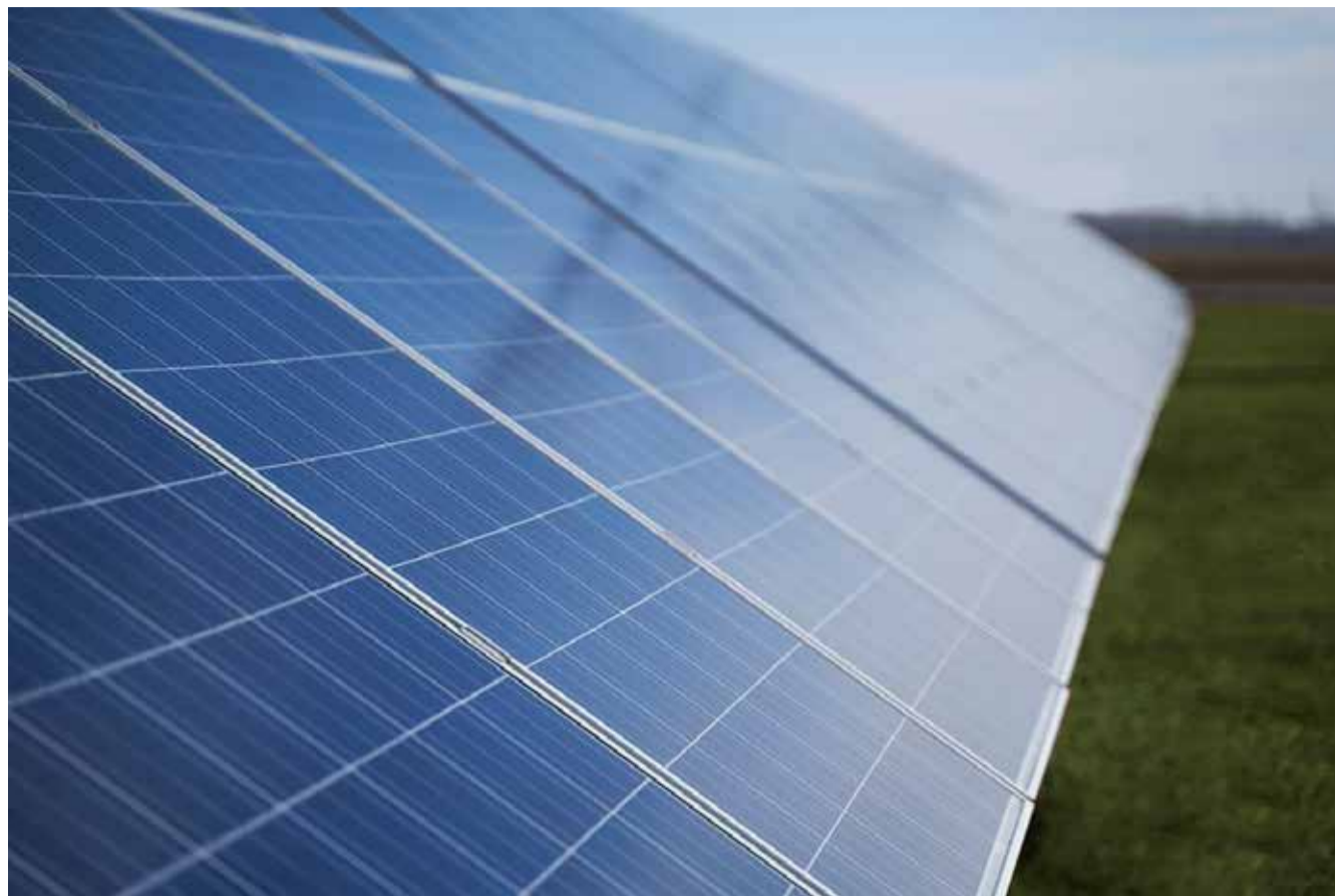
Borgernes klimapulje gik i 2024 til to lokale projekter, der bidrager til et mere klimavenligt lokalsamfund.