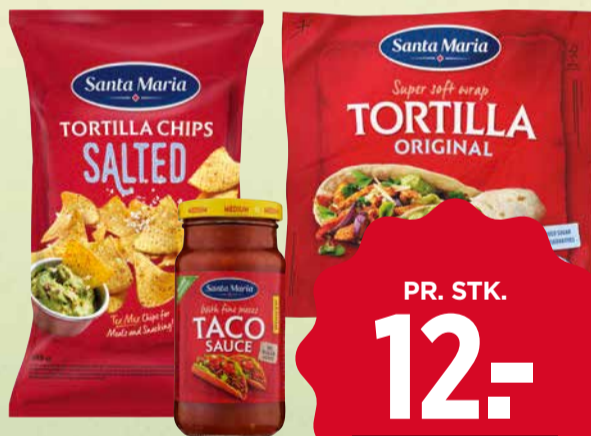
SANTA MARIA TEX MEX Flere varianter. 250 ml./15-371 g. Literpris 48,00 Max. Kg pris 800,00.