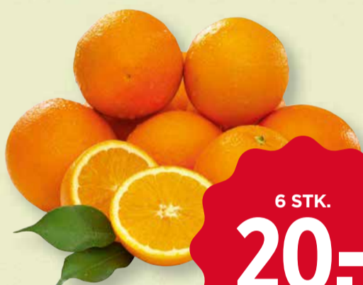
STORE APPELSINER Udenlandske. Stk. pris v/6 stk. 3,33.