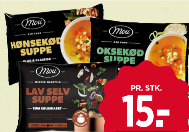
MOU SUPPE Lav selv, Oksekød eller Hønskød. 1 kg. Frost