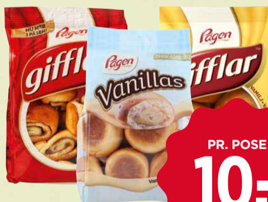
PÅGEN GIFFLAR ELLER VANILLAS

Gifflar: Kanel eller Vanilje. 220-300 g. Max. kg pris 45,45.