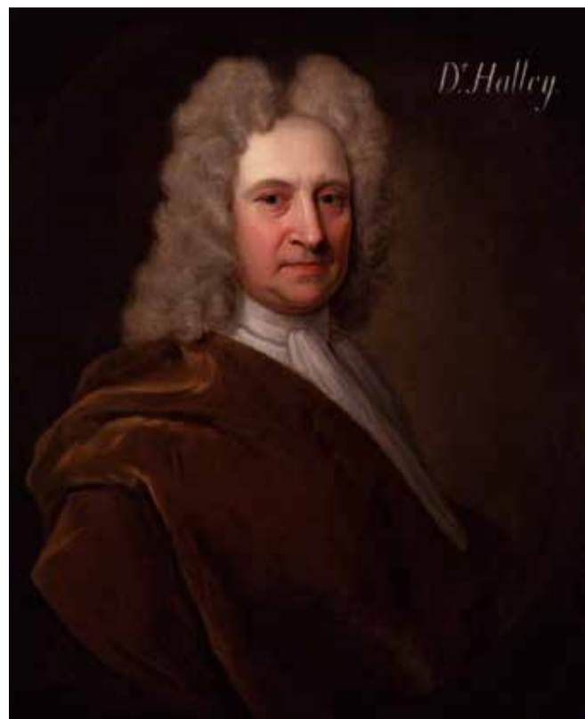
Edmond Halley (1656-1741) af Richard Phillips.