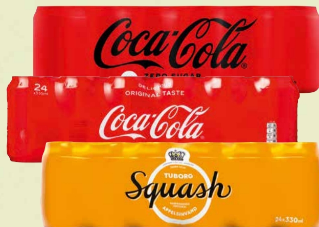
COCA-COLA, COCA-COLA ZERO, TUBORG SQUASH ELLER FANTA Flere varianter. Literpris 8,83. Afhentningspris Sælges kun i