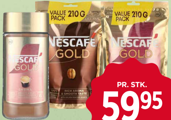
NESCAFÉ GOLD INSTANT KAFFE Flere varianter. 175-210 g. Max. kg pris 342,57.