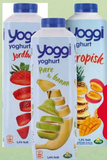
YOGGI YOGHURT Flere varianter. 1 kg.