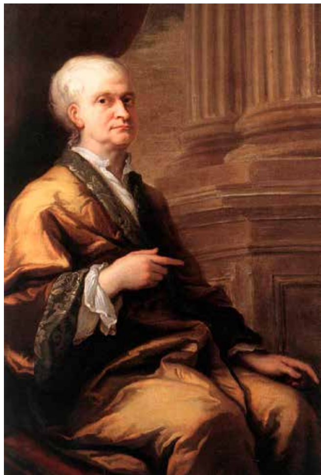
Isaac Newton portrætteret som 70 årig (1712). Portræt af Sir James Thornhill.