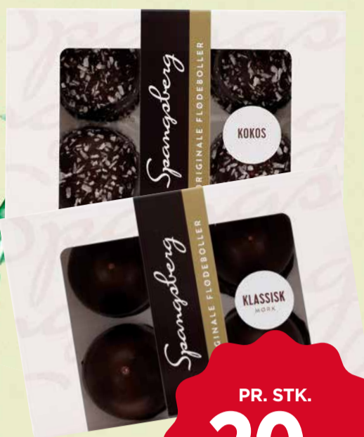
SPANGSBERG FLØDEBOLLER Flere varianter. 124 g. Kg pris 161,29.