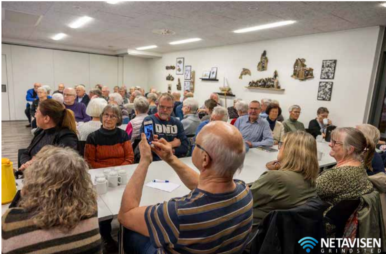
Interessen for seniorbofællesskaber i Sdr. Omme er stor. 70 deltog i et orienterende møde i Sdr. Omme Multicenter.