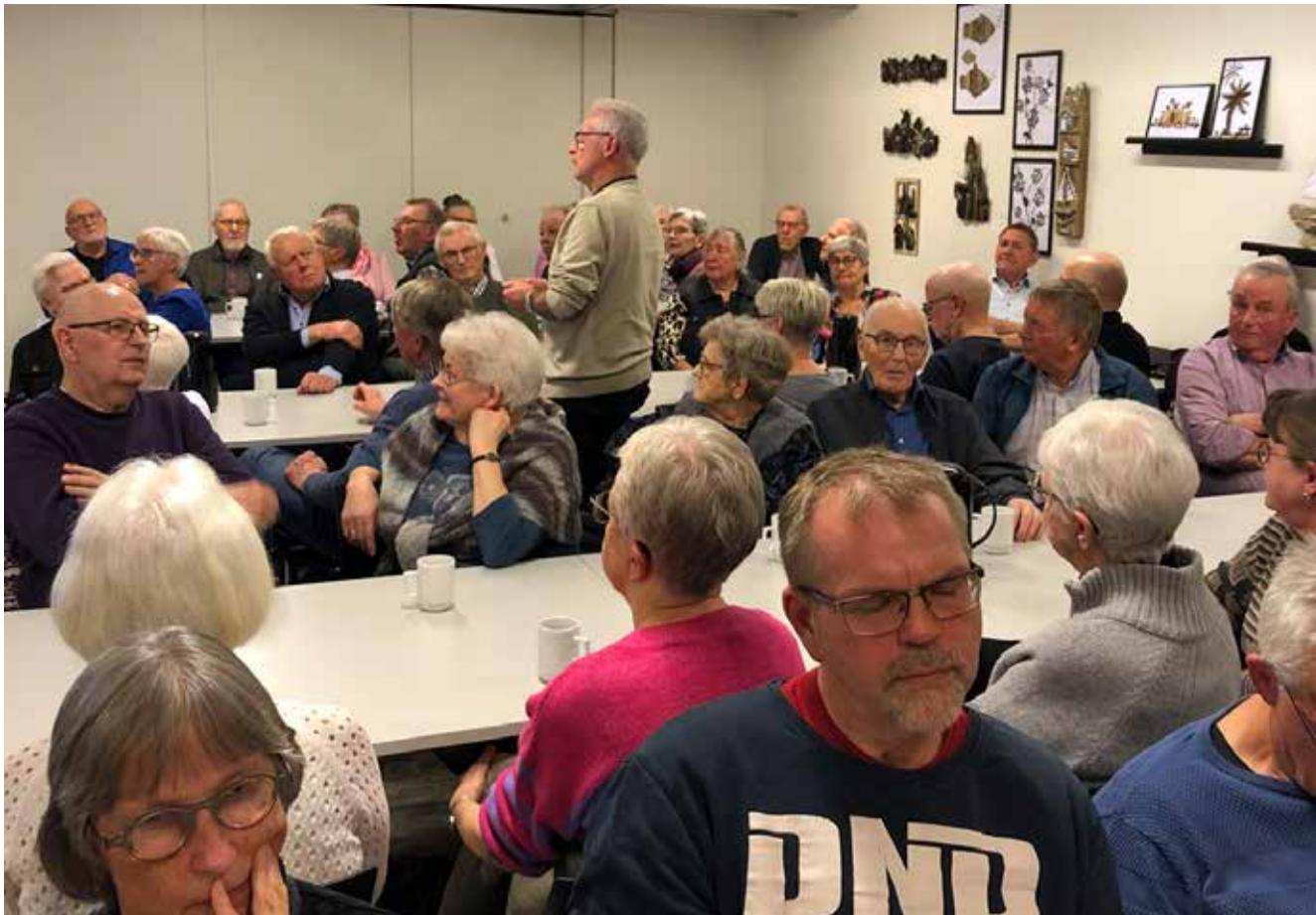
Lige så mange spørgsmål der var til projektet, lige så mange ideer og forslag var der til, hvordan et bofællesskab kunne se ud.