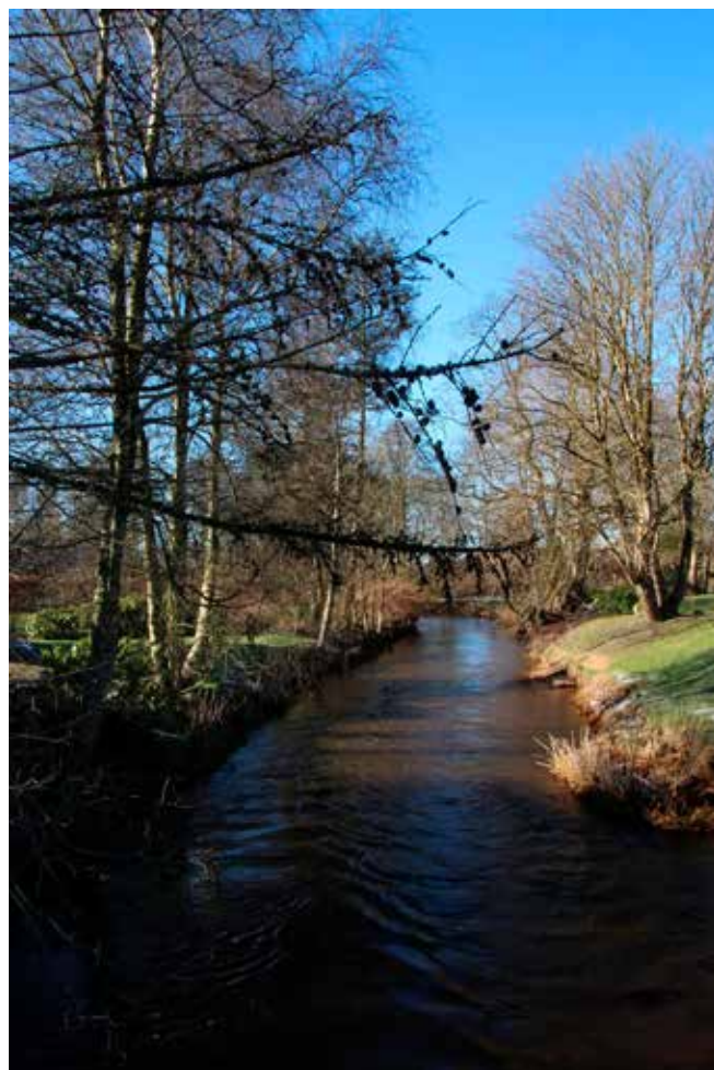
En solrig vinterdag. Henrik Thøstesen har indsendt dette billede. Et smukt kig i retning vest fra broen over Omme Å ved Grindstedvej. Vi siger tak til Henrik.