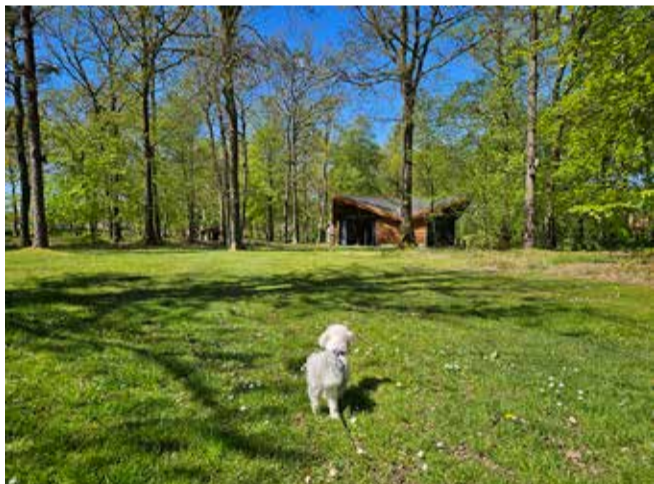
En smuk forårs-fredag. Camilla Thaysen tog det smukke forårsbillede i Holdgårdsanlægget på en tur sammen med hendes lille Sia.