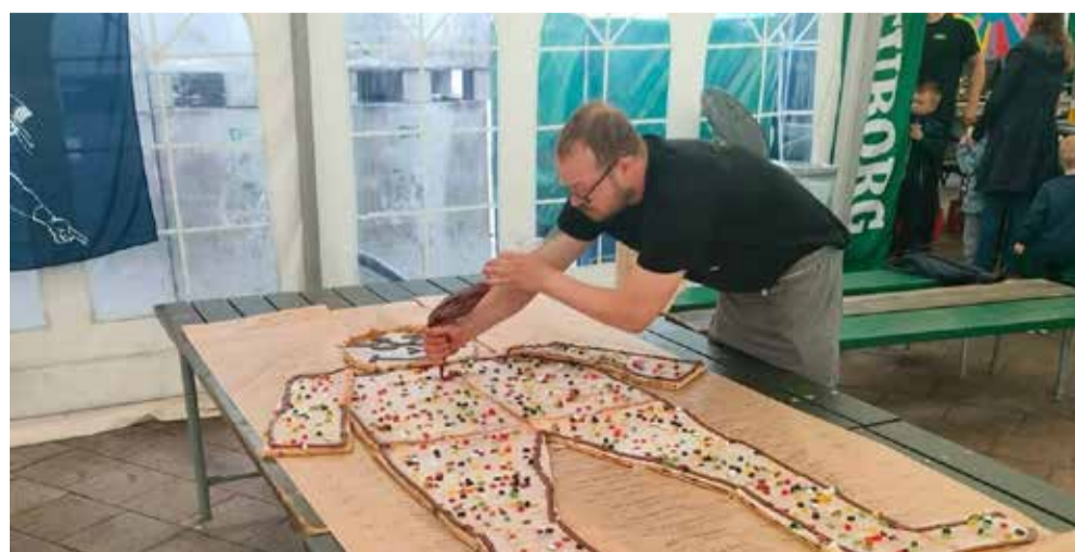
Fredag i jydefesten serveres gratis kagemand til børnene. Sponsoreret af Sdr. Omme Bageri.