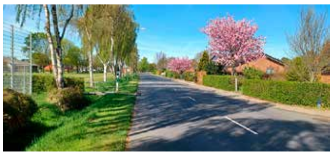
Forårsstemning. Flemming Klausen har taget det flotte billede af Stadion Allé på en smuk forårsdag.