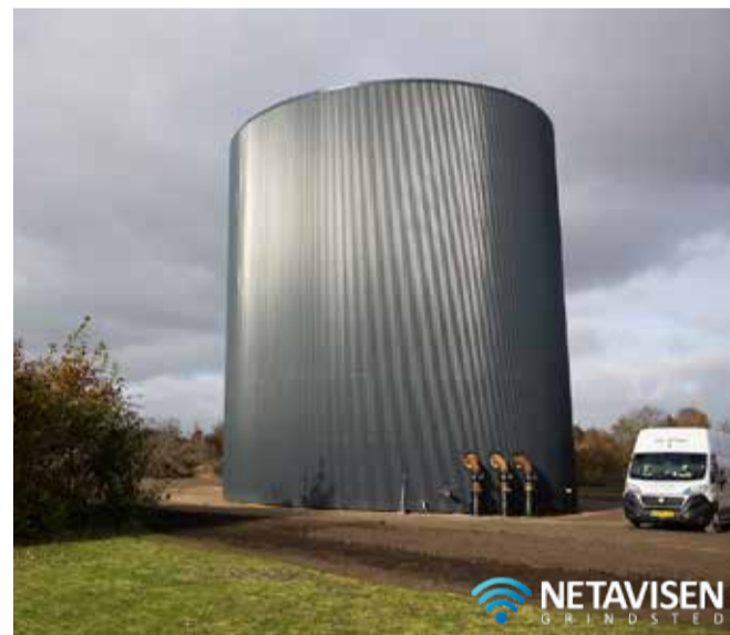
Den nye akkumuleringstank på 18.000 kubikmeter.