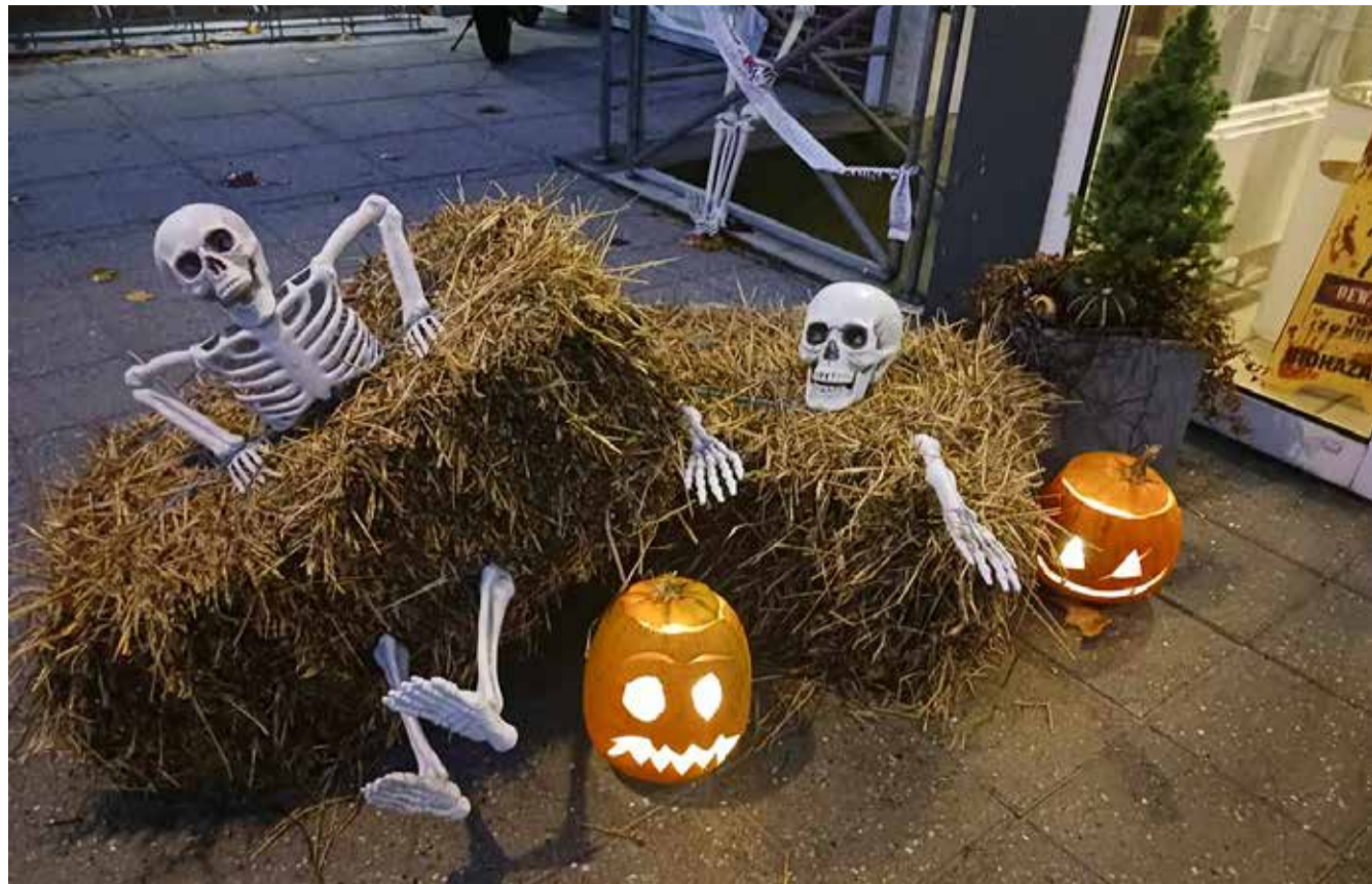
Tekst og fotos: Kristina Svejstrup, Omme Plejehjem.

Mandag den 28. oktober besøgte ikke mindre end 60 børn Omme Plejehjem til et Halloween arrangement.