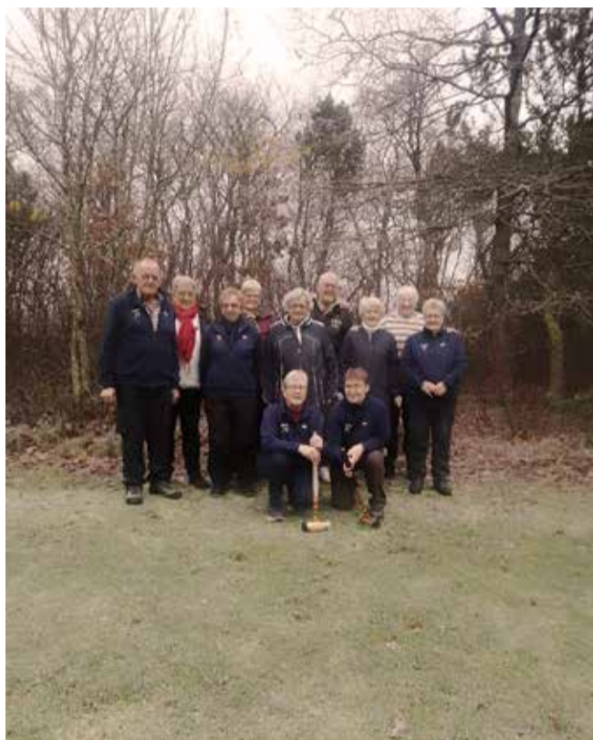
Billede fra julekrocket i 2023.

- Af Evylin Flugt, fra bestyrelsen i Bøvl I.F.