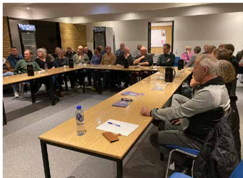
26 interesserede borgere deltog i informationsmødet om Byens Hus.