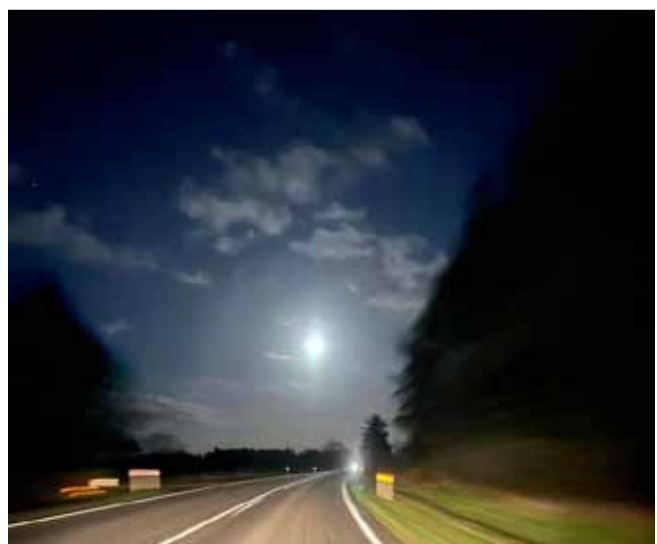
"Super fuldmåne i aften". Gitte Holm sendte os dette billede den 16. november.