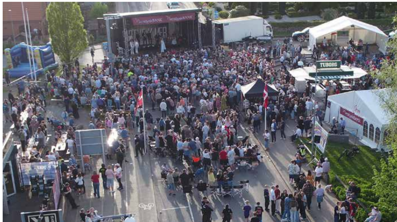
- Fra facebook siden "Sdr. Omme".