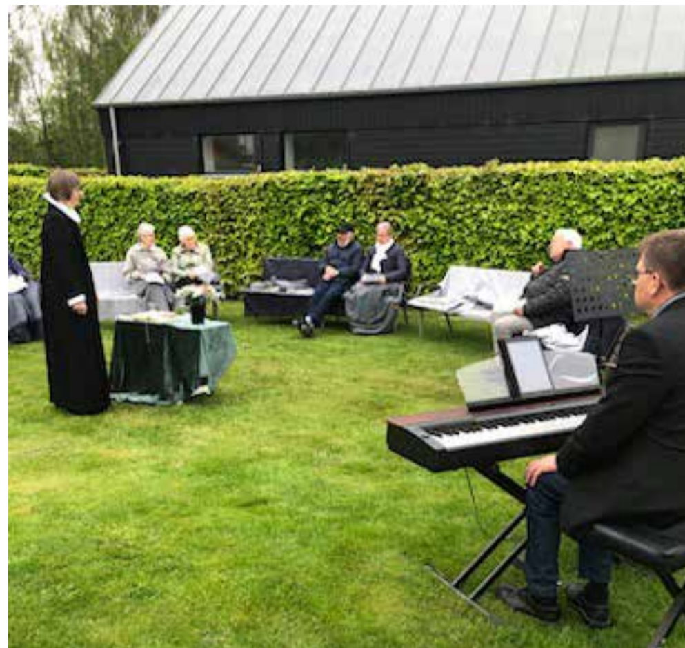
- Af Peter Sigsgaard Sørensen.

Kristi Himmelfartsdag kl. 9.00 blev der afholdt udendørs gudstjeneste på græsarealet bag graverbygningen. En lidt kølig morgen, men kirkepersonalet havde sørget for, at der var bænke, hynder og masser af tæpper, så ingen skulle fryse.