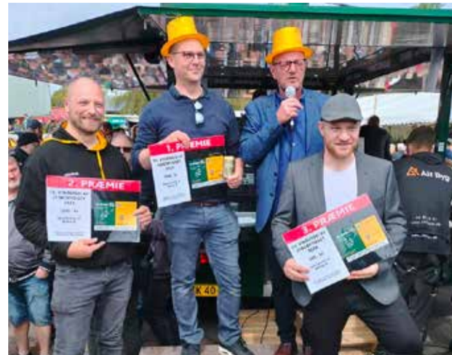
Vinderne af optoget var de tre mest kreative og opfindsomme indslag. På 1. pladsen var det Kædestrammer foreningen, på 2. pladsen var det Sdr. Omme E-sport og Sdr. Omme Kro indtog 3. pladsen.