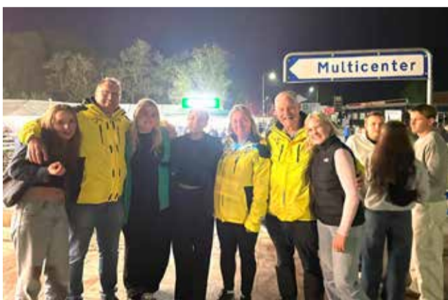
Stemmingsbilleder fra De Glade Jyders Fest's 50 års jubilæum. Natteravne fra Grindsted kom på besøg.

De frivillige i skydevognen kunne melde alt udsolgt, og det var nødvendigt at køre efter nye forsyninger af drikkevarer, til lørdagens jubilæumsfestival.