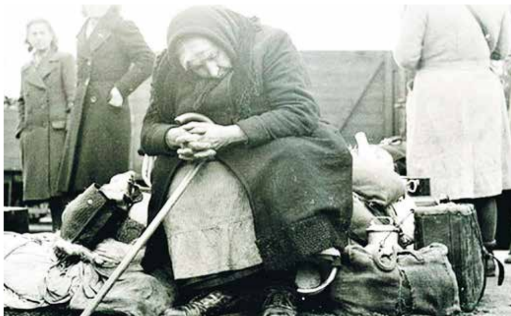
Tyske flygtninge i 1945.