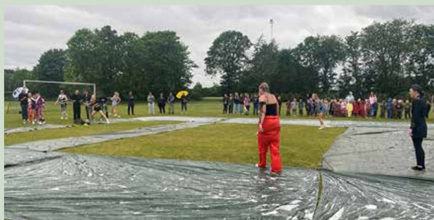
I forrige uge blev sidste skoledag for 9. årgang 2024