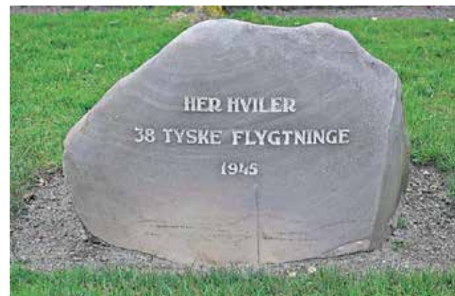
Mindesten over 38 tyske flygtninge på Grindsted Kirkegård.

syge og udmarvede kvinder og unge mødre, der var ude af stand til at amme og fortvivlet knugede deres