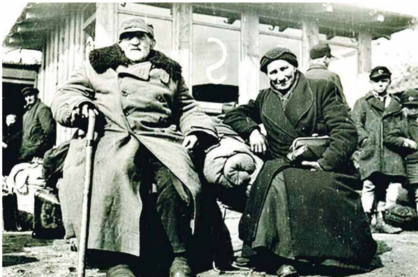
Tyske flygtninge i 1945. - Billund Museum Besættelsessamlingen 2.