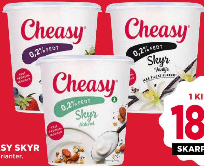
CHEASY SKYR Flere varianter.