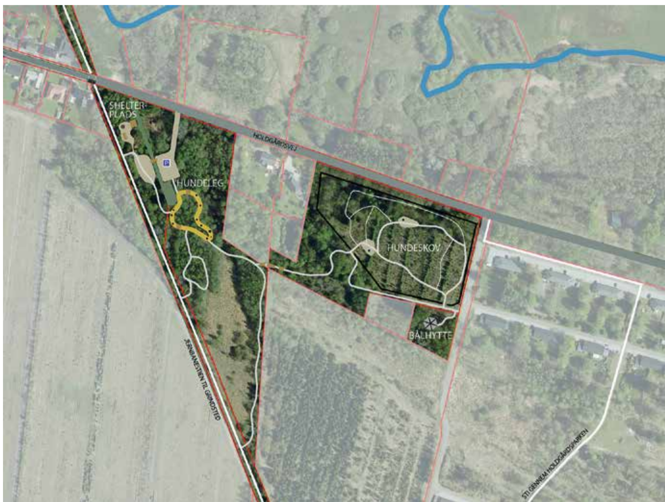
Oversigtskort over Sdr. Ommes nye hundeskov.

Hundeejere og hunde i Sdr. Omme og omegn kan glæde sig til den 31. august, når byens nye hundeskov bliver indviet med et festligt arrangement. Projektet er støttet med midler fra Billund Kommunes pulje til områdefornyelser.