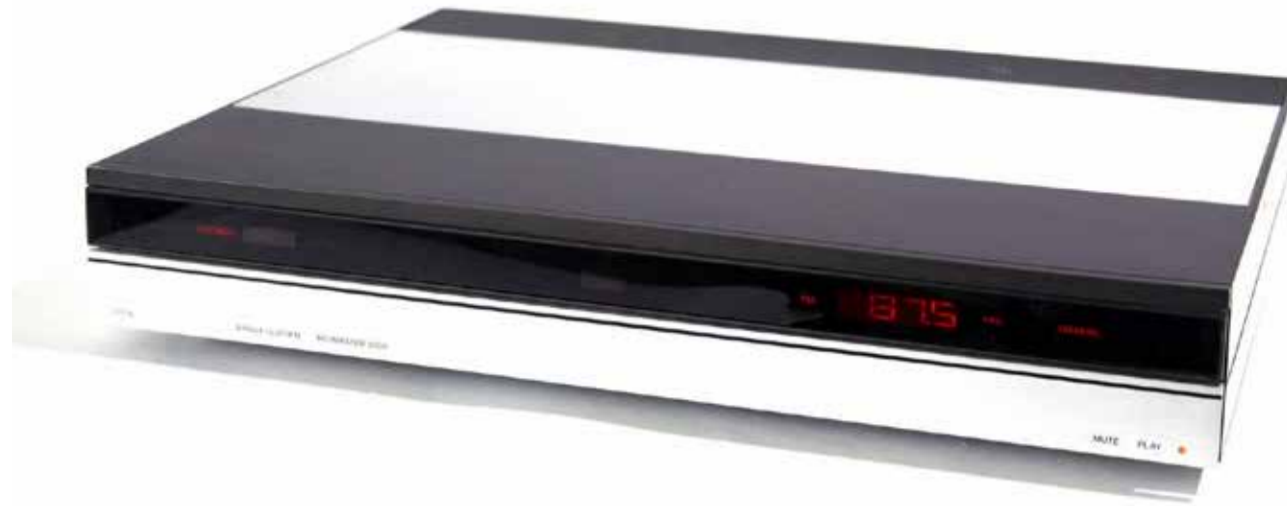
Foto: Beomaster 5000