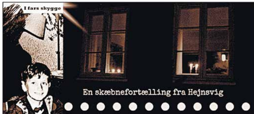
Louis Bulow i fars skygge.