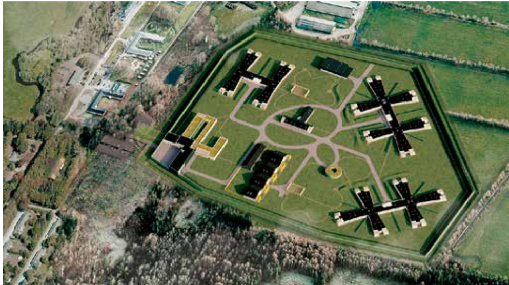
Foto: Illustration fra udbudsmaterialet: Alex Poulsen Arkitekter, Viborg Ingeniører og Bara Land