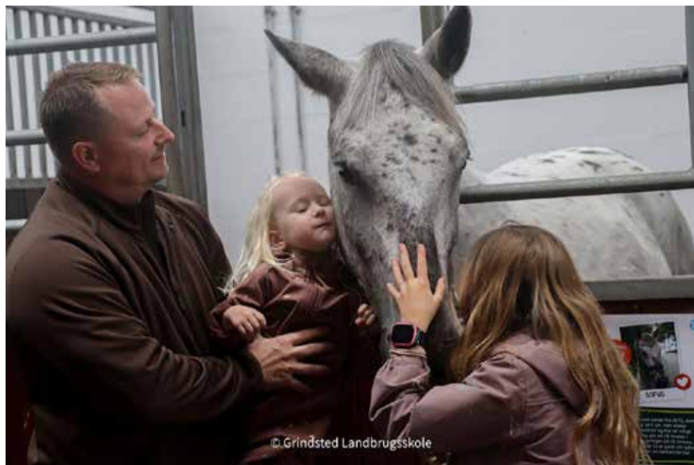
Tekst og fotos: Grindsted Landbrugsskole.

Søndag den 15. september 2024 var en helt særlig dag på Grindsted Landbrugsskole. For første gang i skolens historie afholdt vi "Åbent Landbrug" som en del af Landbrug & Fødevarers landsdækkende arrangement, og det blev en dag fyldt med smil, oplevelser og hyggelige stunder for både børn og voksne. Med hele 1150 tilmeldte besøgende var der en summen af liv og aktivitet hele dagen.