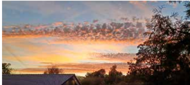
Smuk solnedgang over Sdr. Omme. Billederne er taget i tirsdags den 17. september kl. 19.43. AH