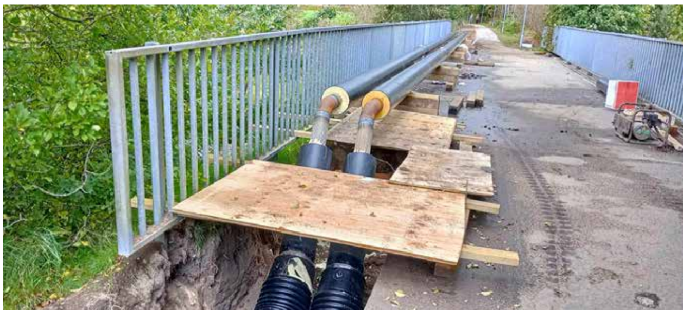
Billedet er taget på cykelstien mod Grindsted ved Omme Å. Det viser fjernvarmerørene, der skal føres ud til fængslet.