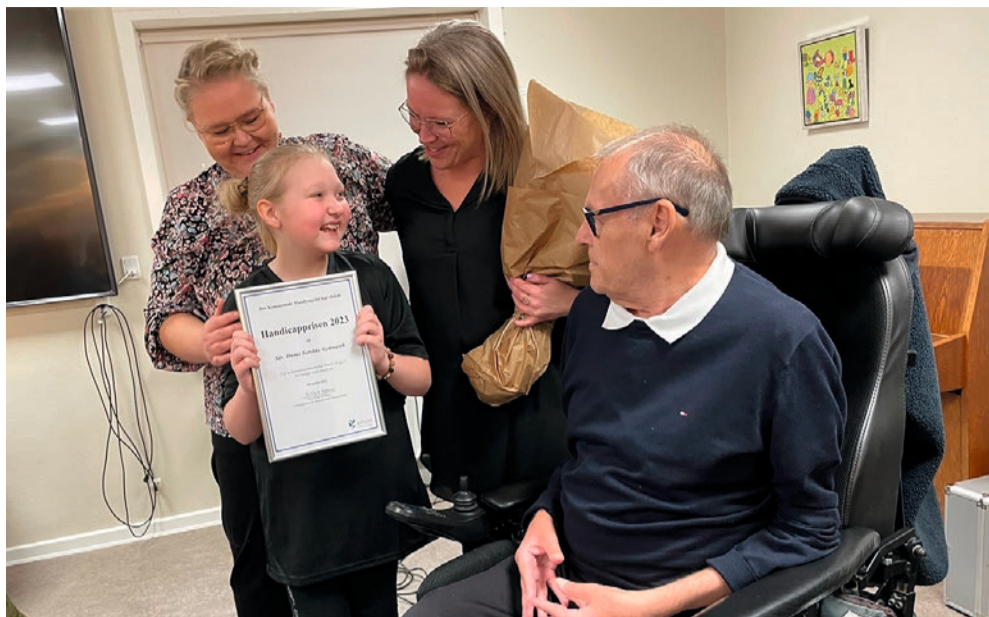
Ved prisoverrækkelsen sidste år gik den ene af de to priser til Sdr. Omme Solsikke Gymnastik.

Prisen er delt i to - den ene modtager udpeges direkte af Handicaprådet, og den anden udvælges blandt de indstillede personer eller foreninger. Der følger 10.000 kr. med hver af priserne, og pengene skal bruges til fordel for målgruppen og til fortsat udmøntning af kommunens handicappolitik.