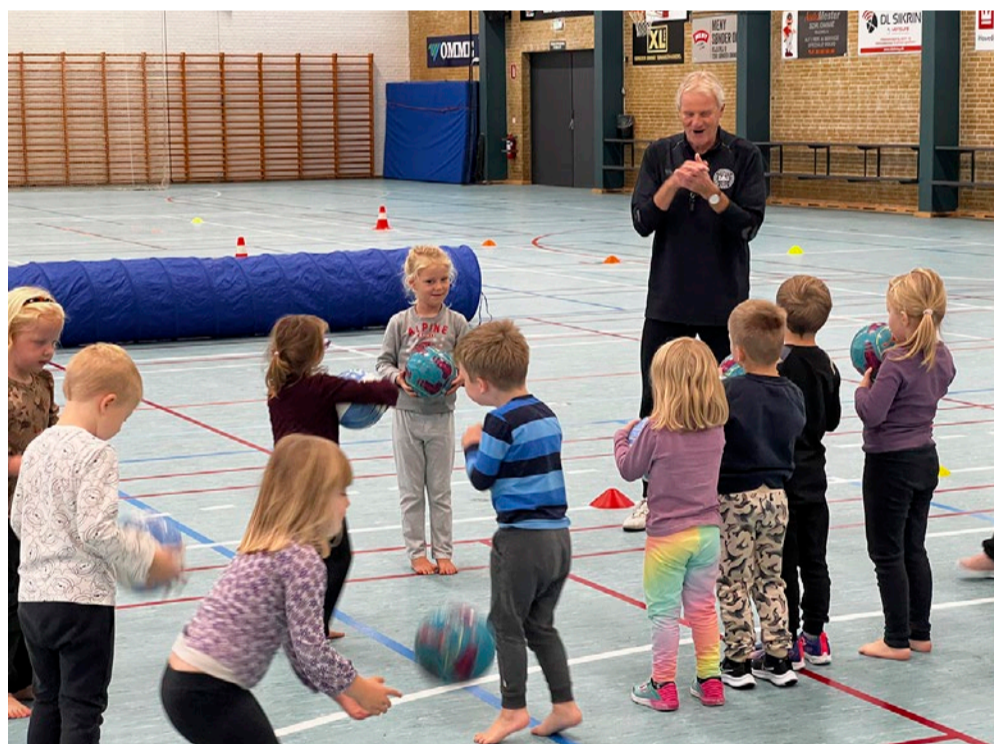
Børnene fra Børnehuset Skovly var rykket inden for i Sdr. Omme Multicenter, da de onsdag den 9. oktober trænede fodbold sammen med en børnetræner fra DBU og en træner fra Sdr. Omme IF.

BILLUND KOMMUNE: Børnehaven fra Børnehuset Skovly i Sdr. Omme er hen over efteråret blevet introduceret til fodbold. Forløbet, som strækker sig over tre